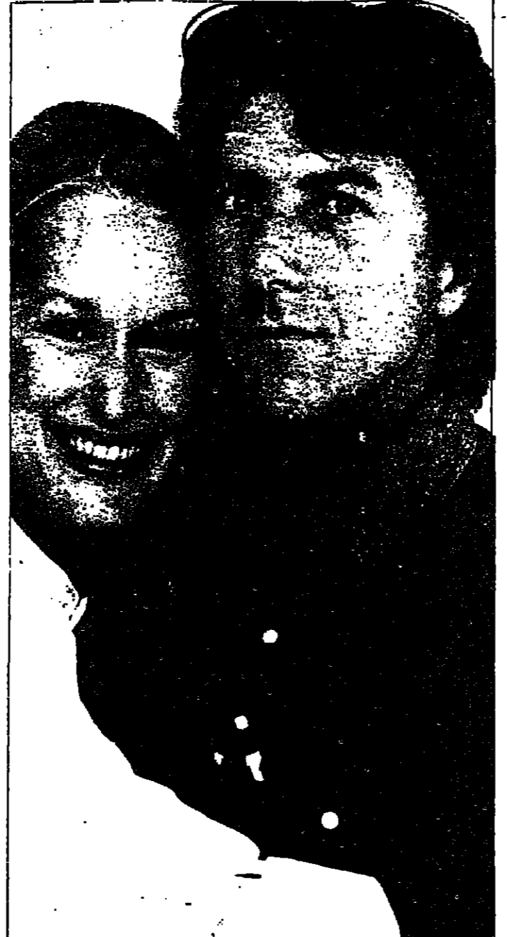
من الفيلم الجديد (كرايمر ضد كرايمر) : غزو عاطفي

في هذا الاتجاه بدأ ظاهرا ، عبر التجاح الذي حققته الافلام التي انتجتها السنيما - وفي عدادها الافلام المذكورة - غالبة السنة الماضية للظلال . وعندما نتحدث عن (العواطف) ، لا نقف عند الميودراما نخب ، بل نتمدى حدودها الى العواطف الأخرى ، شرط ان تكون «مربحة» ، بمعنى من المعاني ! فليس قالموس هوليوود ان الجمهور يتجاح الى دموع كثيرة ، والى فسخ كثير ، والى رعب كثير - اكثر من اللزوم - لانه يفضل كل ما هو خارج من حياته اليومية ! والافلام الفاجحة ، في هذا الموسم (نافسة - حاضرة) تؤكد هذا المظهر ! مثلا ، في فيلم (كرايمر ضد كرايمر) - القوي ان يكون فيلما اجنابيا - هو فيلم «مركبة» ، من انه الى اياته ، بعملية مضطمة لاستمرار الديموع ! ان ، في السنيما ، اليوم ، تجبر كبر (للخوافظ الخاصة) ، للعائلة ، والابوة ! بل فيها فتح صفحة «العائلة» في كتاب التاريخ والتفكير . وقيل ان وراء ذلك : انعكاسات السنيما «المتزومة» وازمتها ! وفي انتظار كلمة علماء الاجتماع - مع ان العملية عملية جاذبة تبيض زهايا - نشير الى ان العودة الابدية لتجتاح الميودراما انتسحت على سلسلة واسعة من الانواع . فعلى «زوج ماري براون» للمخرج الالمانى فاسيندر ، اعتبر من نوع الميودراما ، رغم ان برينش فيه - وما قاله فاسيندر ، وفلسفاه هذا الاجتماع : (علينا ان ننش عن الميودراما ، التي تمسها البروليتاريا ، لا تلك التي